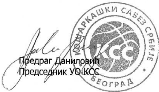
Предраг Даниловић Председник УО КСС